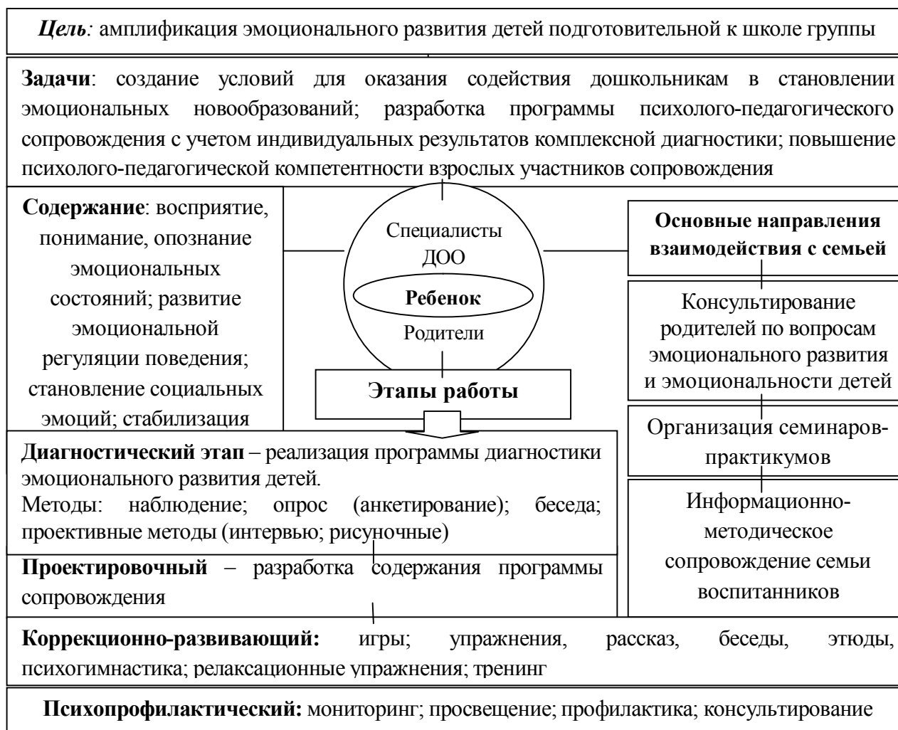
Рис.1. Организационно-содержательная модель психолого-педагогического сопровождения эмоционального развития детей 6–7 лет

Субъектами сопровождения выступили дети 6–7 лет подготовительной к школе группы, воспитатели, работающие в группе, родители (законные представители) детей, специалисты детского сада (педагог-психолог, музыкальный руководитель). В рамках реализации модели предполагалось согласовать работу педагога-психолога, воспитателей, музыкального руководителя, других специалистов в направлении решения вышеозначенных задач и реализации программного содержания.