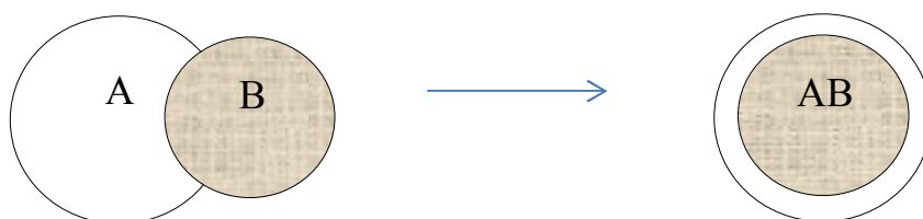
Рис. 1. Расширение тезауруса личности школьника в результате работы над проектом

Считаем, что воспитательный процесс в таком случае будет осуществляться в результате расширения тезауруса личности школьников в ходе разработки ими разных по содержанию и структуре проектов.