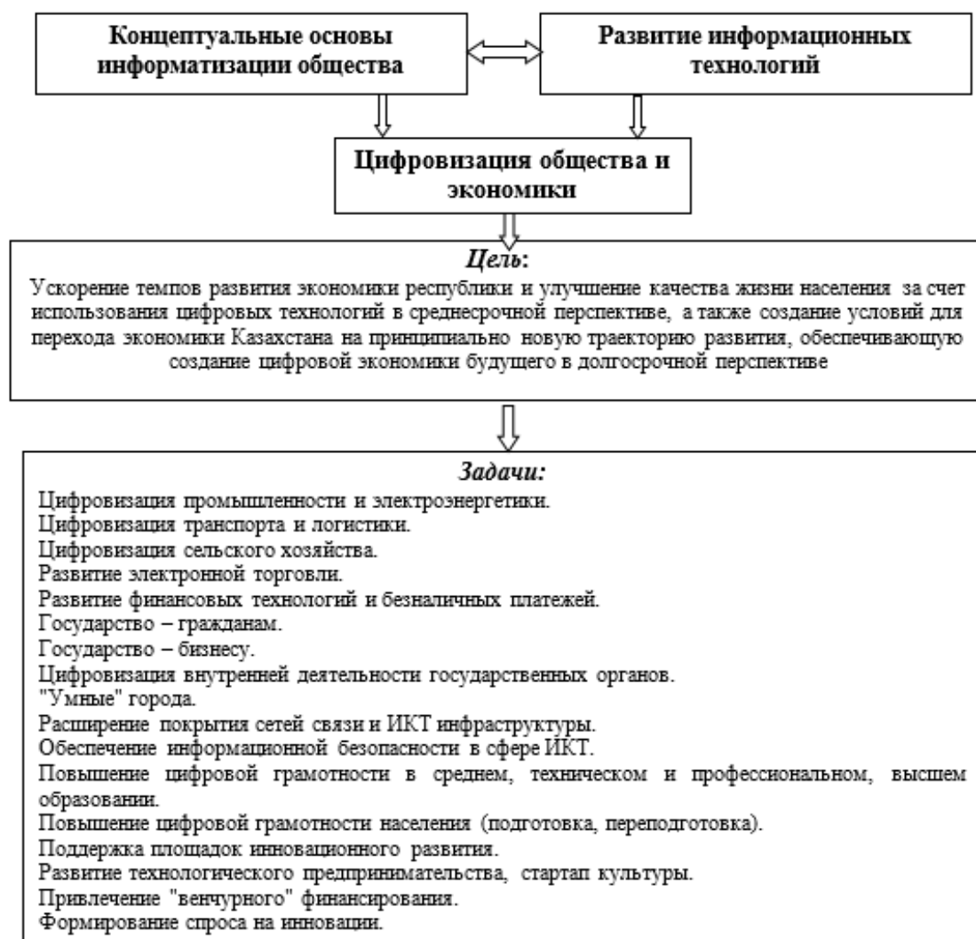
Рис. Предпосылки и задачи цифровизации общества и экономики

В среднем образовании в целях развития у молодого поколения творческих способностей и критического мышления будет поэтапно введен предмет «Основы программирования» (начиная со 2-го класса). Также будут актуализированы программы (5–11-е классы), в первую очередь в части пересмотра языков программирования с учетом включения STEM-элементов (робототехника, виртуальная реальность, 3D-принтинг и др.).